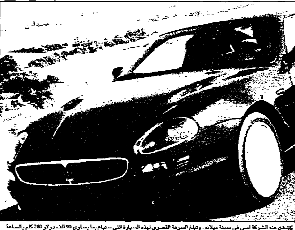
مدونا للحر طراز من انتاج مازيراتي الايطالية كشفت عنه الشركة اسس في مدينة ميلانو. وتبلغ السرعة القصوى لهذه السيارة التي ستباع بما يقارب 90 الف دولار 280 كلم بالساعة